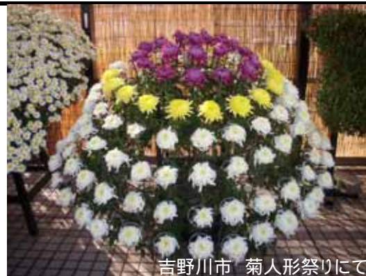
吉野川市 菊人形祭りにて